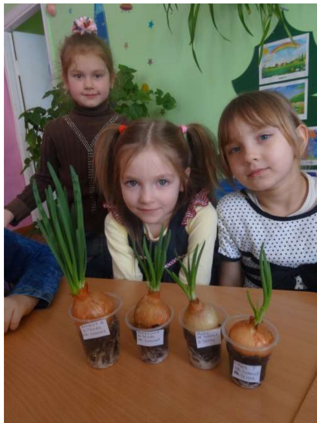
(в тепле, на свету)