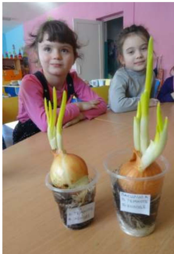
(в темноте, в холоде)