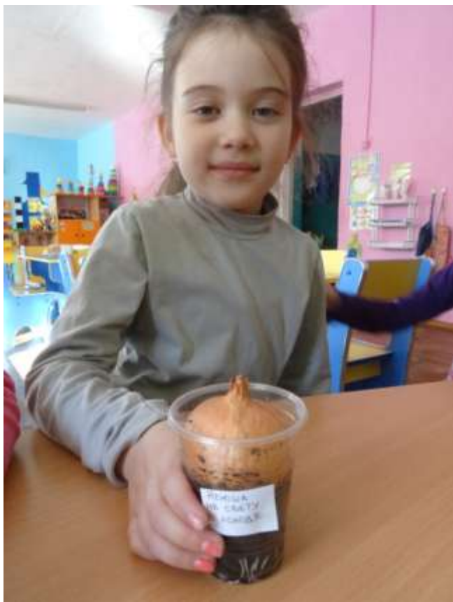
(на свету, в холоде)