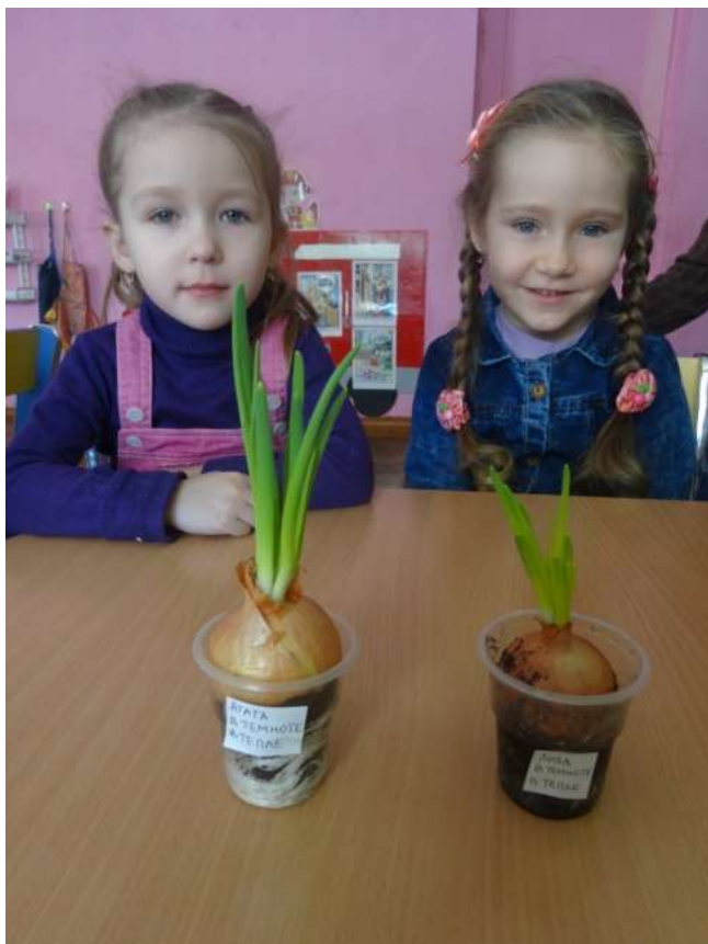
(в темноте, в тепле)